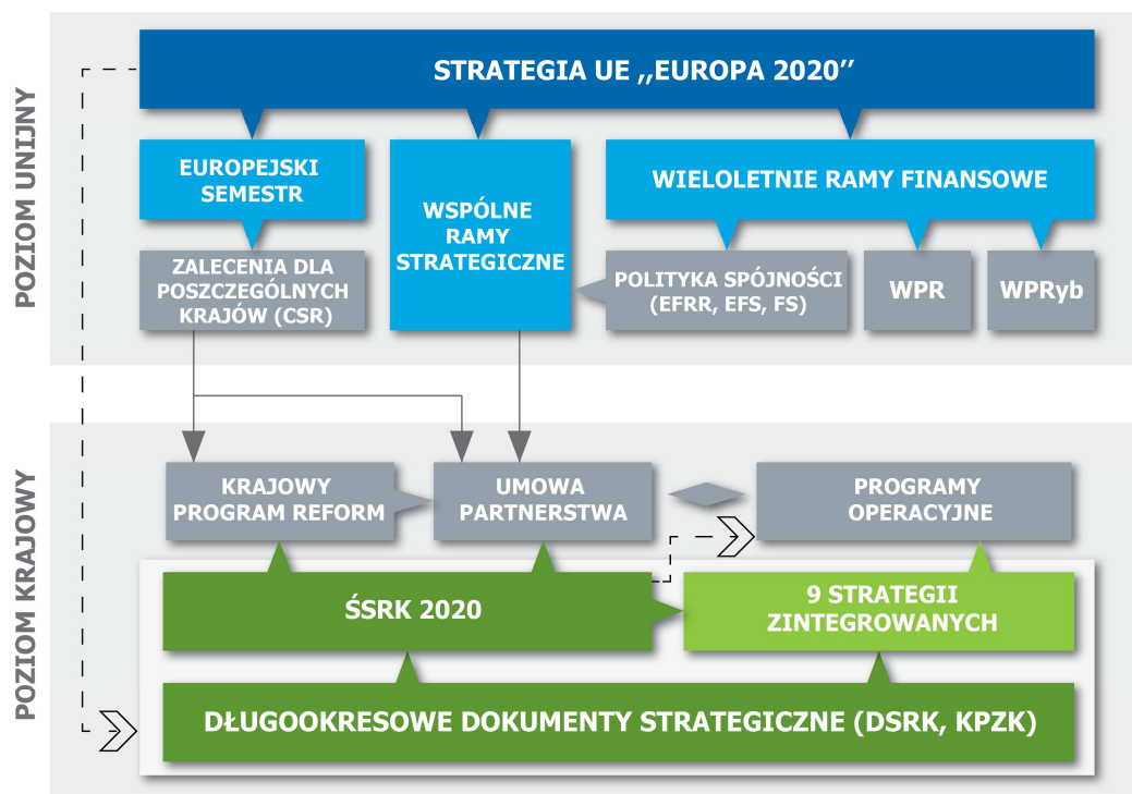
Schemat 2: Zależności i powiązania między dokumentami krajowymi i unijnymi.